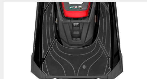
Plate-forme arrière de grande dimension et crochet de remorquage

Le dernier GP est doté d'un immense espace de rangement pour vous permettre de prendre avec vous tout ce dont vous avez besoin. Outre les immenses coffres de rangement sous la selle et à l'avant, vous disposez d'une boîte à gants très grande et pratique.